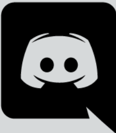
Abb. 2: discord-Logo

-Administrator: Einer unserer FSJler, der sich mit discord ganz gut auskannte, hatte alle Rechte auf dem Server, um schnell Probleme lösen zu können. Er war auch für den Großteil der Zeit online und ansprechbar. Daher haben wir ihn auch liebevoll den „Hausmeister von unserem Freizeitheim“ genannt.